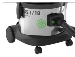
CARRELLO CON DUE RUOTE ANTERIORI GIREVOLI E DUE GRANDI RUOTE PORTERIORI